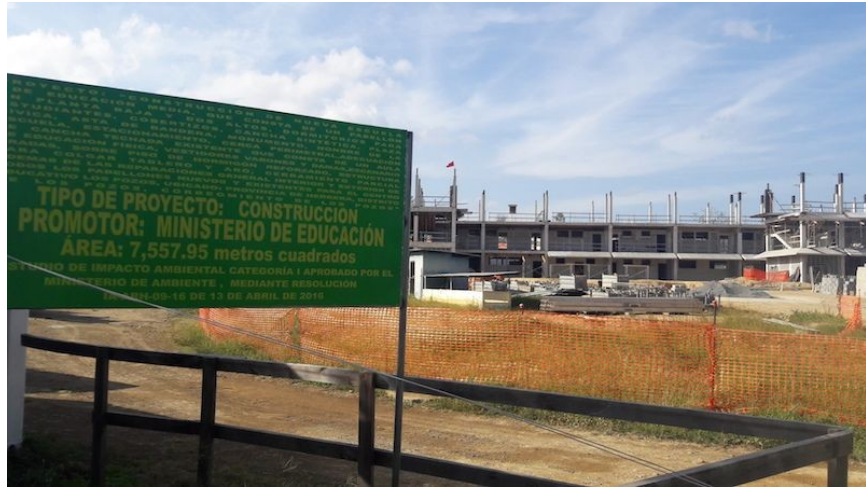
Colegio de Los Pozos