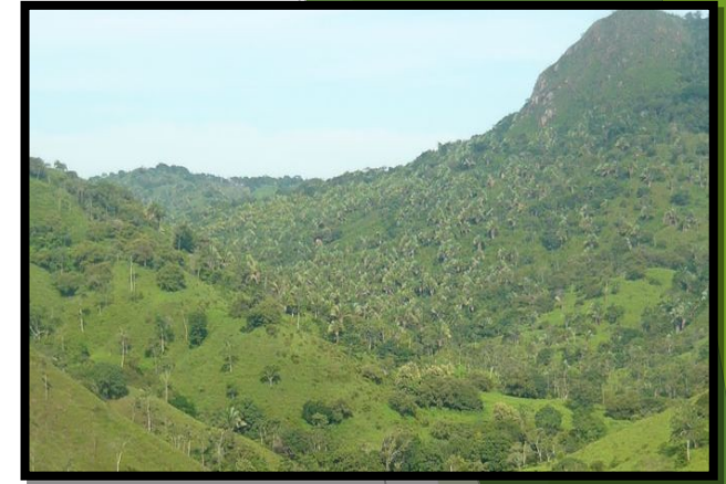
CERRO EL PEÑÓN, Refugio de vida silvestre